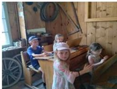
Die Schulbänke von anno dazumal werden auf Herz und Nieren getestet