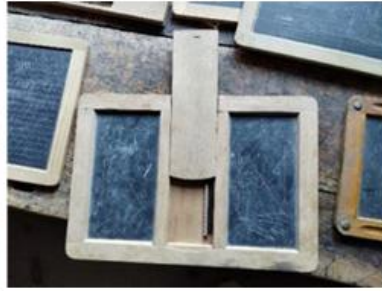
Das "Schwarze Gold" von Elm - ein Handwerk, das den Ort über Generationen geprägt hat