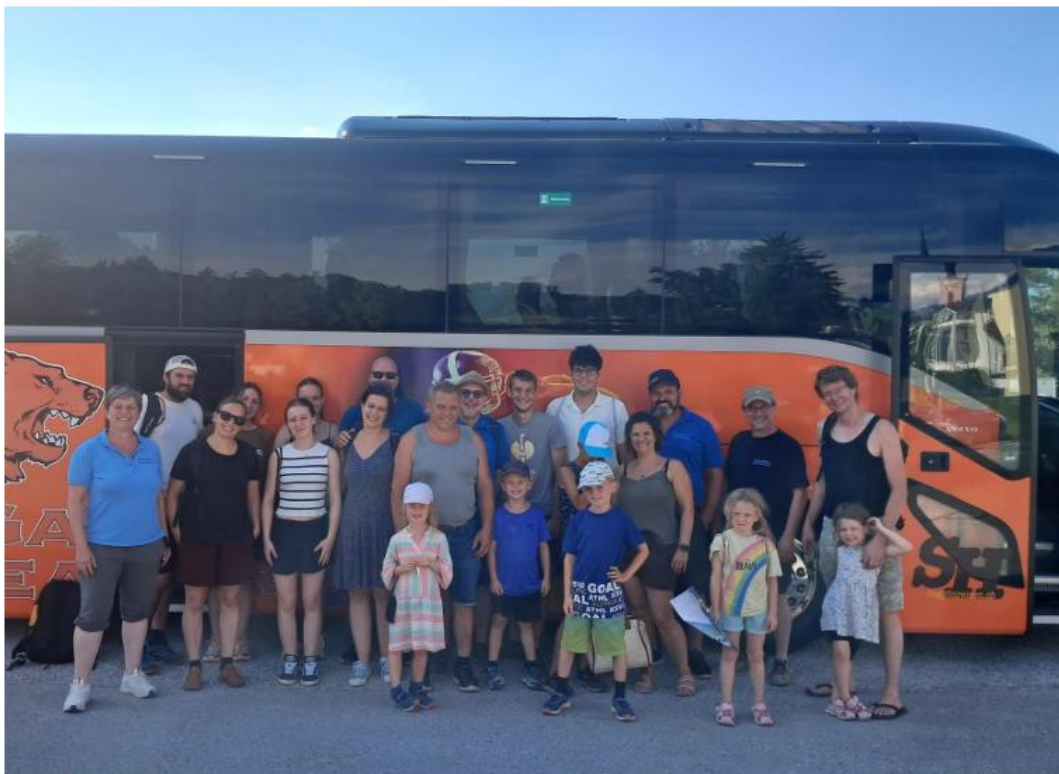
Die Heimatbühne Werdenberg unterwegs: sonnengewärmt und mit vielen schönen Erinnerungen im Gepäck

Nach dem Mittagessen zog es uns weiter an den Walensee. Von Weesen wanderten wir nach Betlis, begleitet von Sonne, Schweiss und der Hoffnung auf Schatten. Die willkommene Erfrischung fanden wir schliesslich im Restaurant – und einige Mutige zusätzlich im See. Zum Abschluss brachte uns das Schiff zurück nach Weesen – mit frischem Lüftli, zufriedenen Gesichtern und vielen schönen Eindrücken im Gepäck.