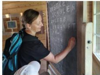
Schreiben mit dem Griffel - das will geübt sein!

Nach dem Mittagessen zog es uns weiter an den Walensee. Von Weesen wanderten wir nach Betlis, begleitet von Sonne, Schweiss und der Hoffnung auf Schatten. Die willkommene Erfrischung fanden wir schliesslich im Restaurant – und einige Mutige zusätzlich im See. Zum Abschluss brachte uns das Schiff zurück nach Weesen – mit frischem Lüftli, zufriedenen Gesichtern und vielen schönen Eindrücken im Gepäck.