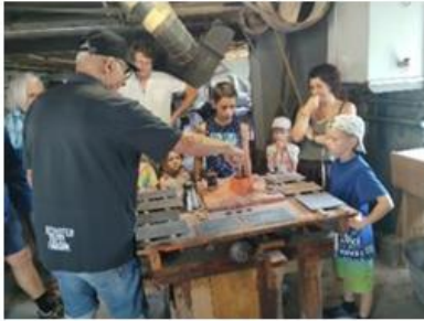
Eine Schiefertafel entsteht – dazu braucht's rund 30 Arbeitsschritte

(pd) Bei strahlendem Sommerwetter startete unser Familienausflug nach Elm. In der Schiefertafelfabrik erfuhren wir spannende Geschichten rund um das historische Handwerk.