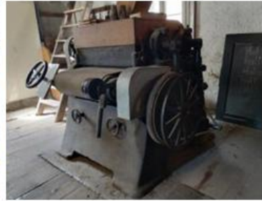
Reliquie aus vergangenen Zeiten: Die Schleifmaschine machte die Tafeln glatt und beschreibbar